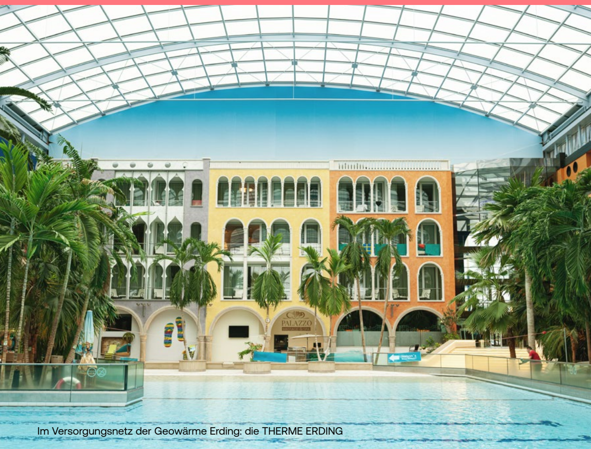
Im Versorgungsnetz der Geowärme Erding: die THERME ERDING

In Erding bei München befindet sich eine der größten Fernwärmeversorgungen auf geothermischer Basis. Der Anschlusswert liegt derzeit bei rund 69 Megawatt und soll bis auf 75 Megawatt ausgebaut werden.